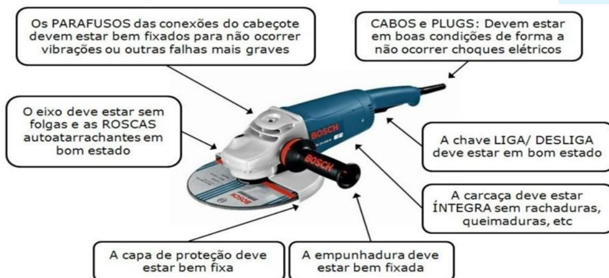
Figura 1: Esmerilhadeira com os requisitos de funcionamento

Prezando sempre pela segurança de todos, a organização impedirá a utilização de máquinas, equipamentos e ferramentas que estejam sem as devidas proteções e em mau estado de conservação a ponto de gerar um acidente. A Figura 2 ilustra uma esmerilhadeira com todos os requisitos de funcionamento.